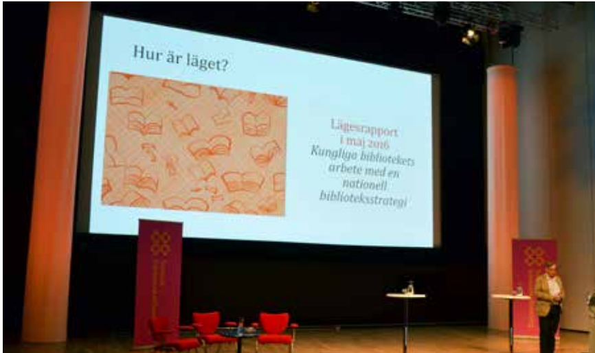
Sverige får ny biblioteksstrategi. Vad som har gjorts hittills presenterades på biblioteksdagarna i Västerås i våras.