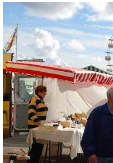
Höstmarknad. Höstmarknaden pågår bara ett stenkast från biblioteket, så passa på att uppleva stämningen!