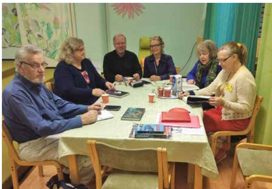
Vårens sista träff. Bilden är tagen i maj, men bokcirkeln fortsätter på hösten.