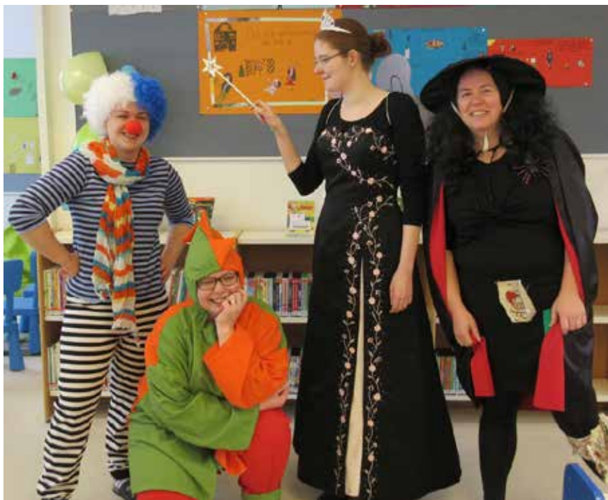
Färgglatt gäng: Roliga clownen, Busiga draken, Goda féen och Snälla häxan.

I en berättelse låg betoningen på det visuella och i en annan på rörelser. Med sagor för sinnet ville vi både uppmuntra barnen att fantisera, det vill säga att arbeta med sina inre bilder, men också lyfta fram vikten av att arbeta med fantasi och inre bilder för daghemspersonalen.