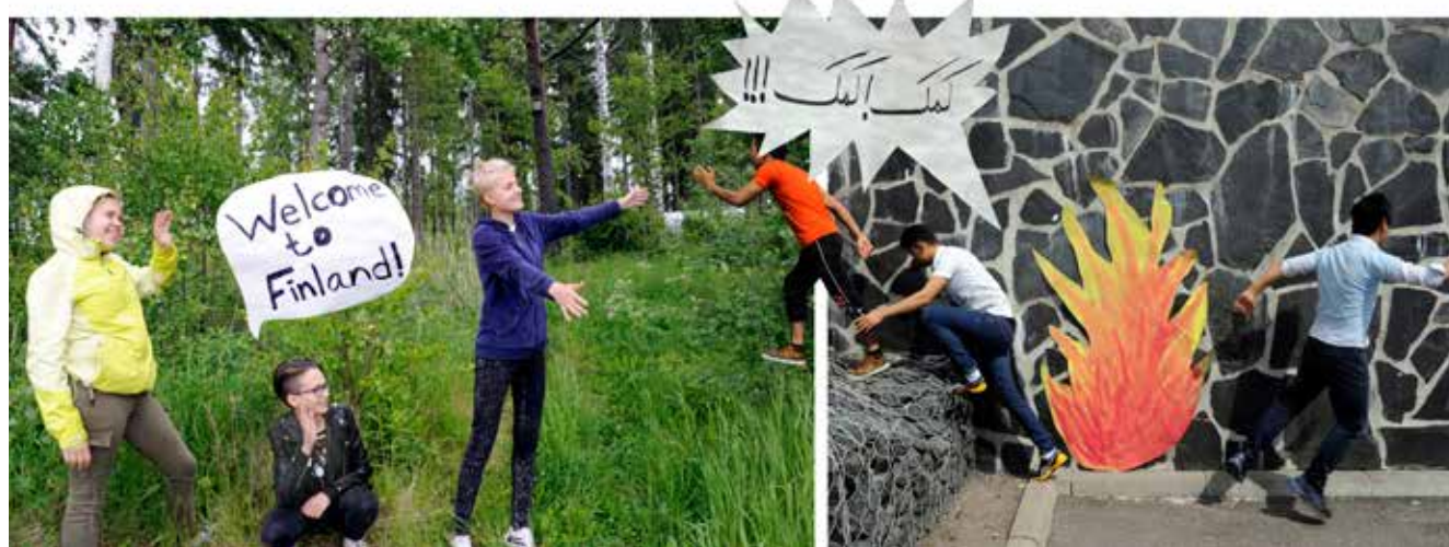
Welcome! Den avslutande seriestrippen i en fotoserie som handlar om skillnaderna mellan Afghanistan och Finland, bland annat när det gäller trygghet. Bild: Heidi Lunabba och lägerdeltagarna