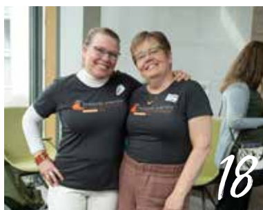
HISTORISK TILLBAKABLICK: FSBF GENOM MINA ÅR