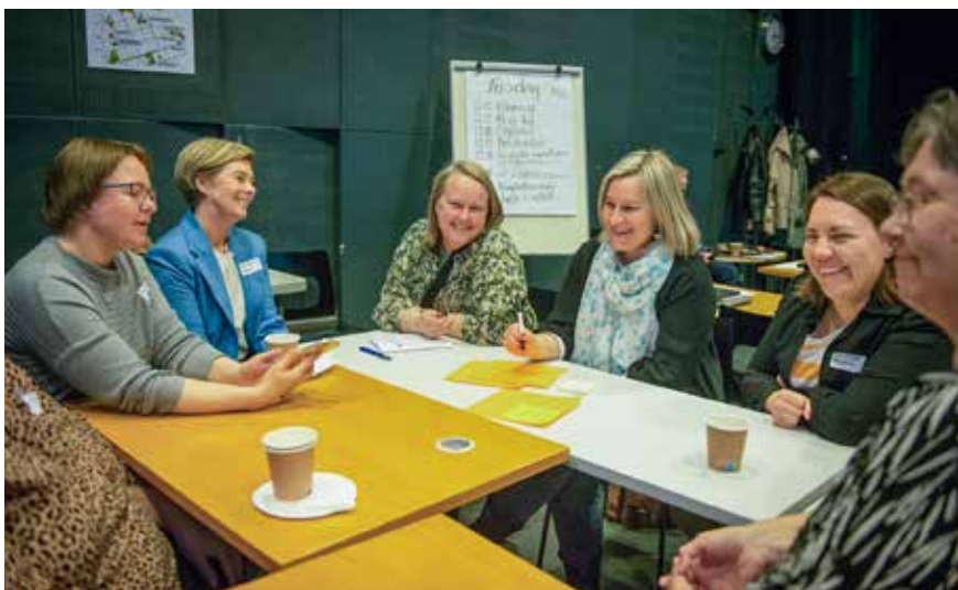
Under muntra former diskuterar bibliotekspersonal från bland annat Malax, Pedersöre, Korsholm och Nykarleby kring uppgiften för grupparbetet.

Den 11 – 12 maj arrangerades Finlands svenska biblioteks dagar i Vasa. Temat för dagarna var "Digital nutid via historiens vingslag", en passande rubrik med tanke på att föreningen samtidigt firade 85 år!