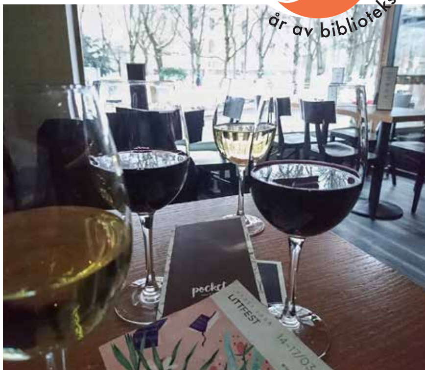
» Föreningen ordnade Afterwork på Pocket innan LittFest 2019.

Årets biblioteksdagar var speciella på flera sätt, ja, rentav historiska. Vi kunde äntligen ordna en riktig konferens igen, på plats. Vi hade för första gången någonsin parallellprogram för allmänna och vetenskapliga bibliotek.