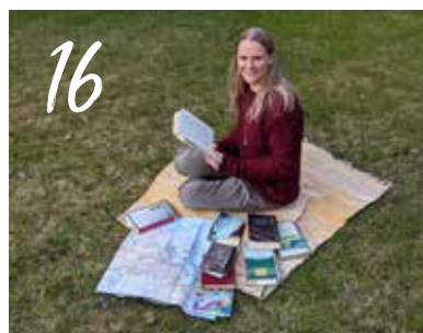
ÅBOLÄNDSKA FÖRFATTARE PÅ LITTERATURSTIGEN

Konferensen i Vasa lockade rekordmånga deltagare. I detta nummer har vi sammanfattat en del av programmet och bjuder på ett bildrikt reportage.