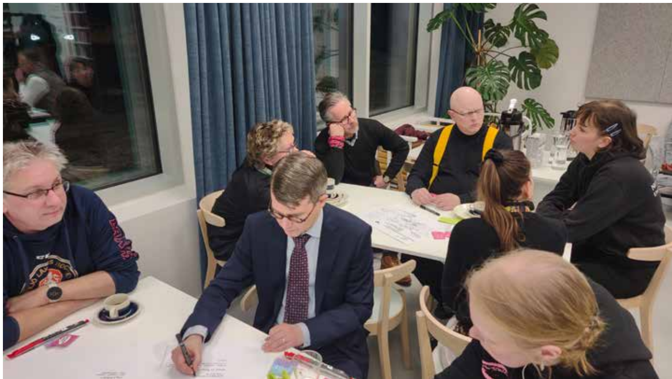
Workshop om ungas delaktighet i Sjundeå.

I samband med riksdagsvalet ordnade man inom ramen för projektet ett mjukisval för unga röstare. Bibliotekens olika mjukisdjur vurmade för olika frågor, till exempel Idrottsmöjligheter åt alla! Bonden behövs! Håll havet rent! , och de mjukisdjur som fick mest röster bildade ett mjukisråd. På så sätt har projektet även engagerat de allra yngsta kommuninvånarna.