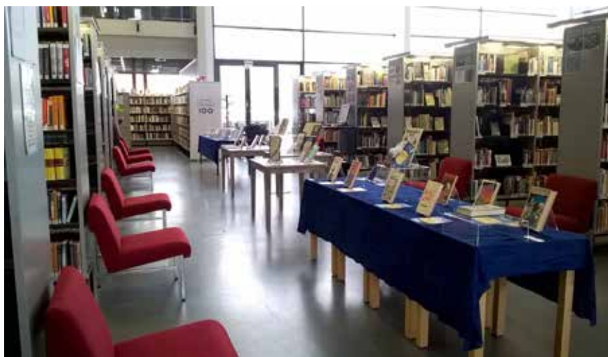
På Borgå stadsbibliotek skapades en skönlitterär utställning kring Finlands 100 år av självständighet.

svenska frågor i synnerhet, anordnande av högklassig och framåtblickande biblioteksfortbildning och att fungera som en mötesplats för biblioteks-människor i Svenskfinland. Dessa tre områden går som en röd tråd genom föreningens historia och det är med stor vördnad jag ser tillbaka på vad föreningen utträttat under sina många verksamhetsår.