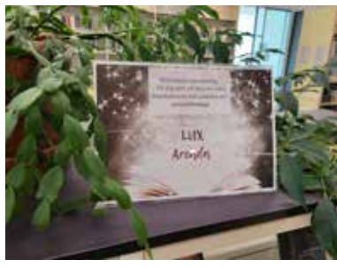
SKÖNLITTERATUR I VETENSKAPSSAMLINGEN