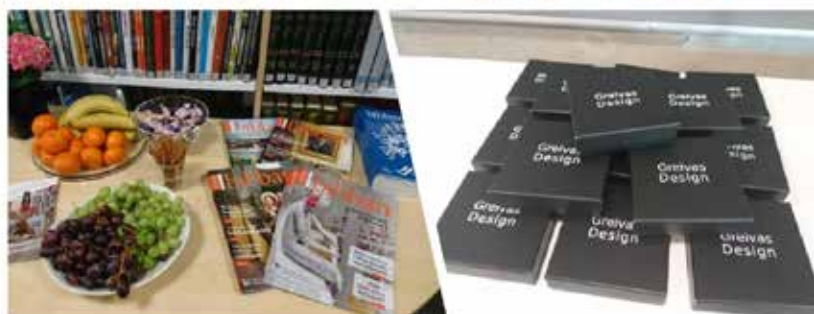
Bilder från biblioteksdagarna 2019.