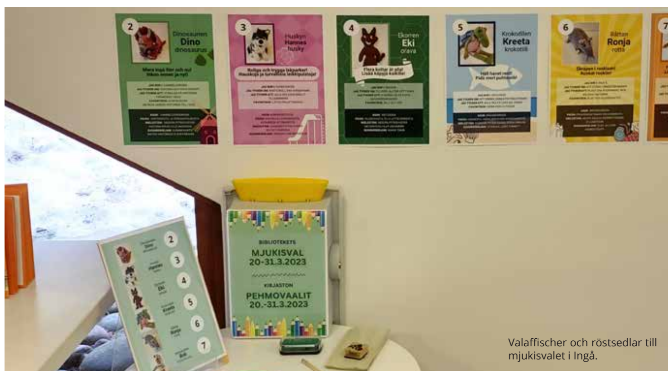
Valaffischer och röstsedlar till mjukisvalet i Ingå.

Valåret har präglats projektets arbete, och i våras ordnades valdebatter i både Sjundeå och Ingå, där representanter från alla riksdagspartier deltog.