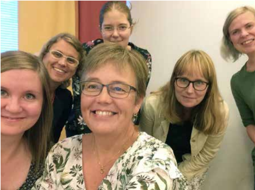
Höstens första styrelsemöte 2018

” Det är en ömsesidig vinst, för det ger väldigt mycket att vara med i styrelsen och det bär man också med sig till sin arbetsplats