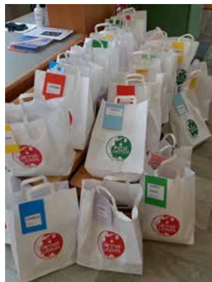
Paketerad sommarläsning från år 2015.